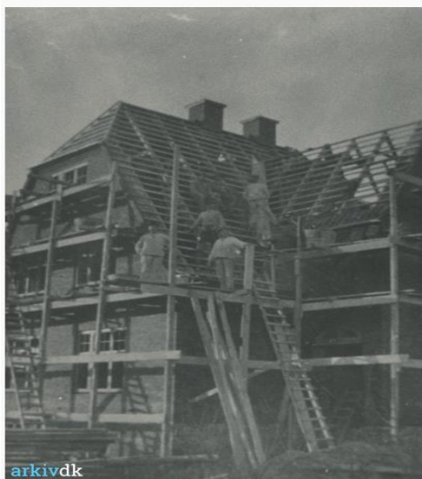
Fruens Bøge Alle 2 under opførelse i 1914