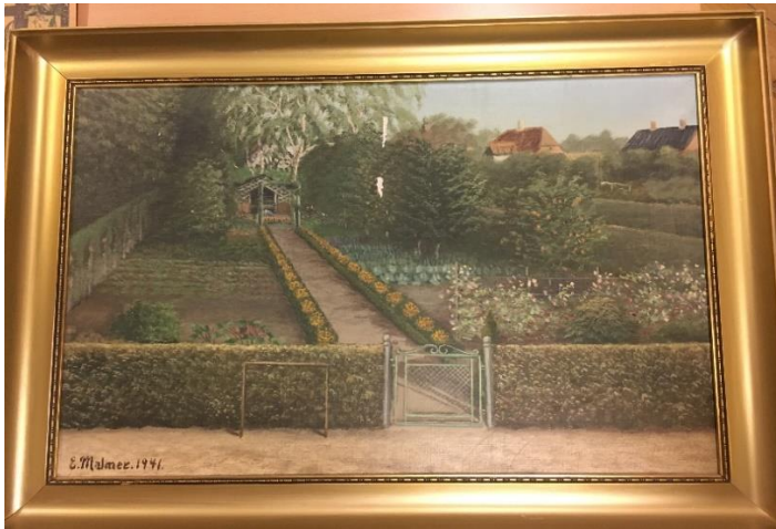
Maleri af grunden på Fruens Bøge Allé 8A cirka 1940.