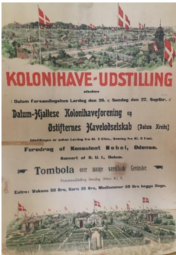
Plakat for kolonihave-udstilling i Dalum Forsamlingshus cirka 1925 På udstillingen var der foredrag og tombola med store gevinster.