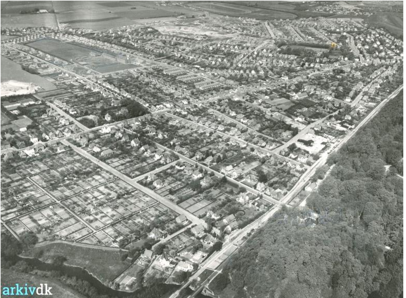
Luftfoto af Fruens Bøge kvarteret 1953

BLIV MEDLEM AF Dalum-Hjallese Lokalhistoriske Forening Mail navn, adresse og telefonnummer til dahjarkiv@stofanet.dk – så modtager du et girokort og seneste nummer af foreningens årsskrift 😊