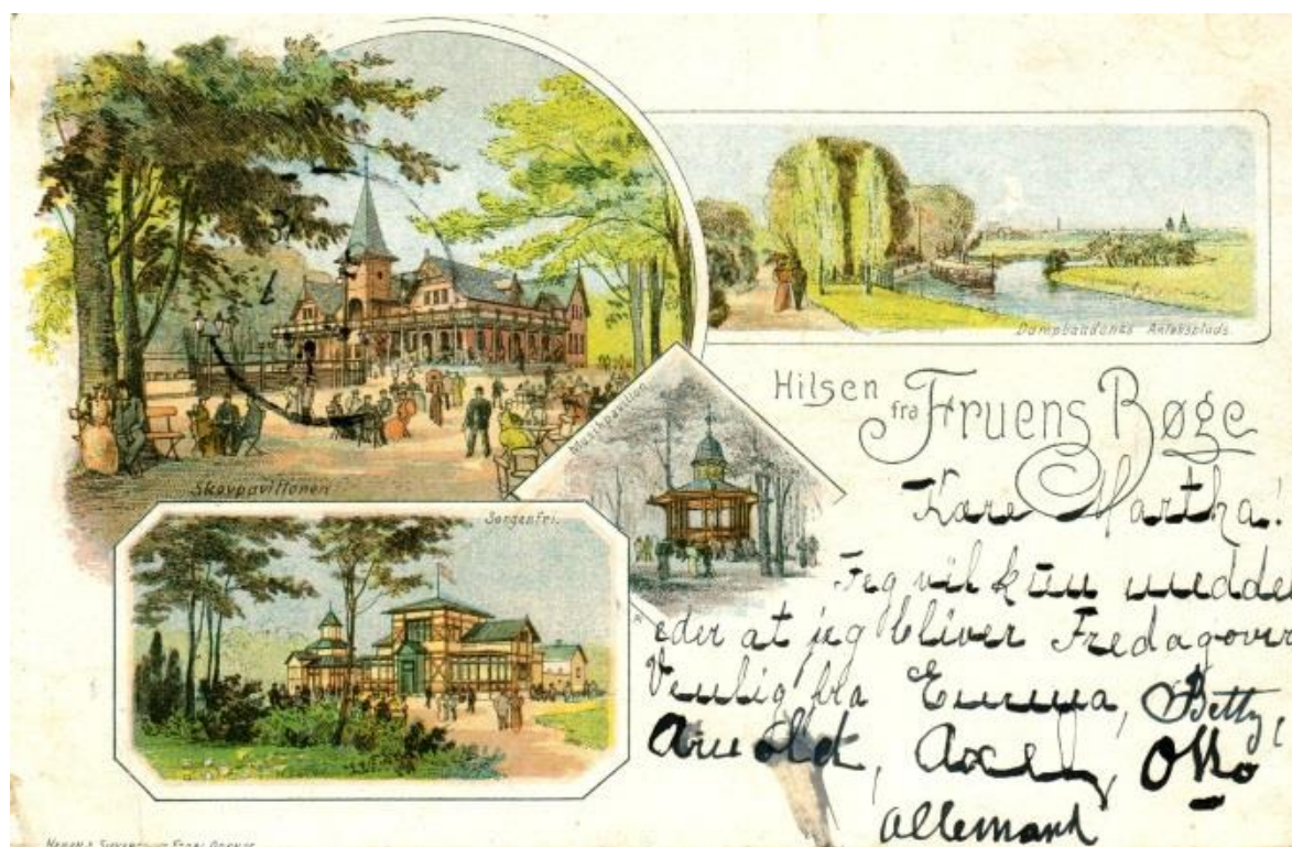
Postkortet "Hilsen fra Fruens Bøge" fra ca. 1910. Øverst til venstre ses Tårnpavillonen med dansepladsen, midt i musikpavillonen, til højre Odense Å og nederst Restaurant Sorgenfri.

I 1906 blev Fruens Bøge station knudepunkt for Odense - Nørre Broby - Faaborg banen, som også benyttedes til godstransport til og fra Dalum Papirfabrik.