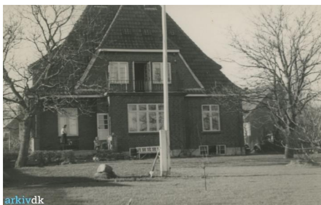
Bakkehuset på Gurlis Allé 1. Bakkehuset er bygget i 1912 og er gadens ældste hus.