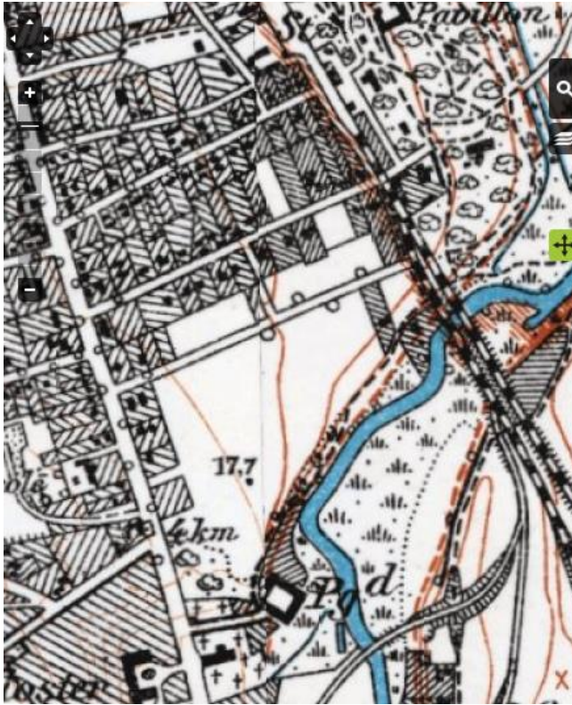
Dalum med Fruens Bøge Allé cirka 1917 med få huse på vejen. På begge sider af vejen ses de grønne områder, der senere blev til kolonihaver.